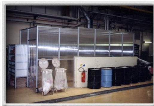
Sas voor afvalsortering