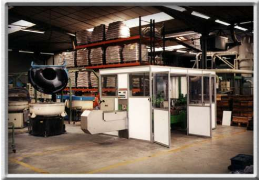
Cabine om te polijsten

Samenstelling van een aluminium structuur vervolledigd met plastic panelen